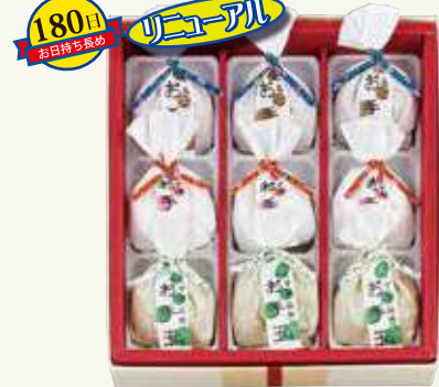
W-34 お手玉しるこ <9個入>

お湯を注ぐだけで、手軽でおいしい「おしるこ」と「くず湯」。心も体も温まる贈り物です。