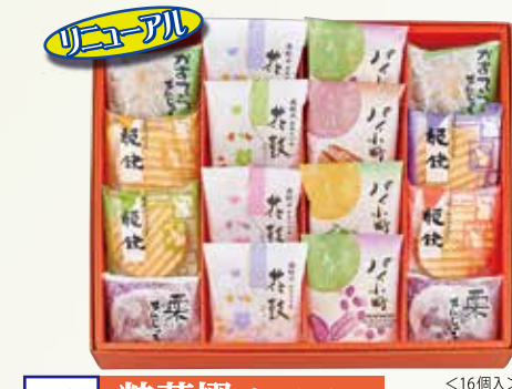
W-26 粋菓撰 すいかせん <16個入>