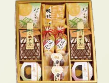
W-36 栗だより <12個入>