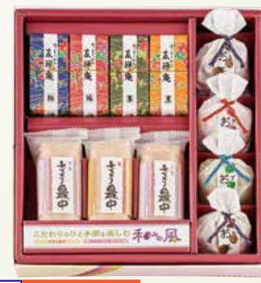
W-32 和みの風 <11個入>

手作り最中、しるこ、くず湯、羊羹の詰め合わせです。昔ながらの製法で心を込めて作り上げました。