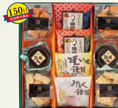
W-25 御菓子の集い <10個入>