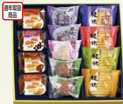
W-23 彩菓撰 <13個入>

お饅頭とパウンドケーキ、ヴァッフェルの詰合せ。幅広い年代におすすめ出来る商品です。