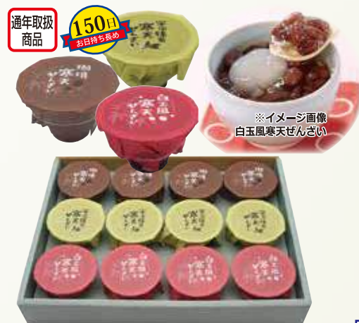
W-31 寒天ぜんざい <12個入>