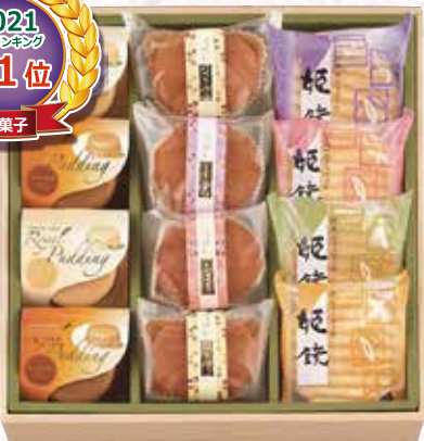
W-19 花菓音 はなかのん <12個入>

ふんわりパウンドケーキに、さくっと食感のヴァッフェル、プリンのお詰め合わせです。