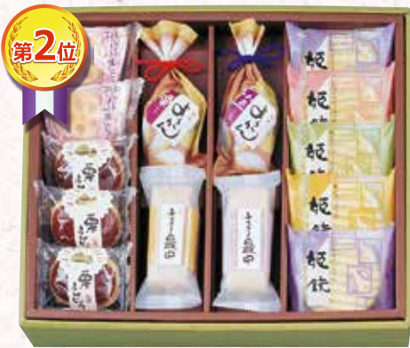
W-20 いにしへの香 <14個入>