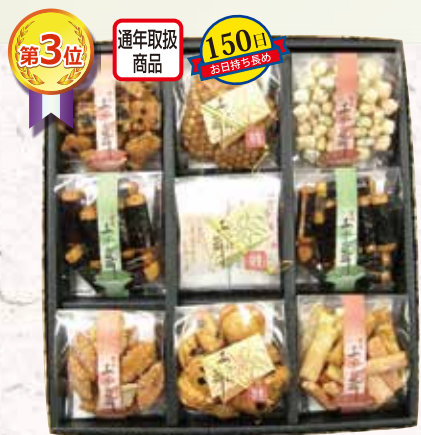
W-21 あかね舞 <9個入>

厳選した国産米を使用。海苔・胡麻・ザラメ・サラダ、定番の美味しいあられが勢揃い。