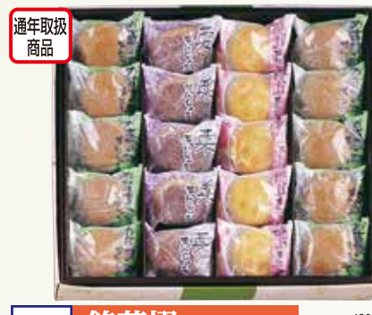
W-24 銘菓撰 めいかせん <20個入>