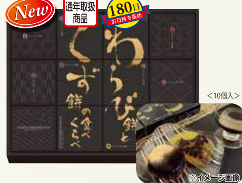
W-30 わらび餅とくず餅のたべくらべ <10個入>