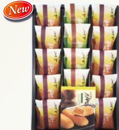
W-28 美味三重奏 <15個入>