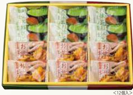
W-27 抹茶まんとお芋まん <12個入>