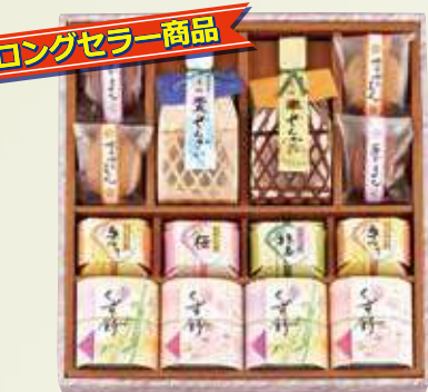
W-22 宴庵うたげあん <14個入>