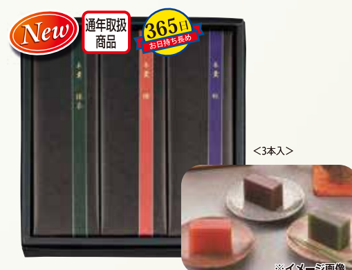
W-29 よるかぜ <3本入>

黒を基調としたシックなパッケージ。上質な原材料を使用し中身、見た目共に誰もが納得して頂ける逸品です。