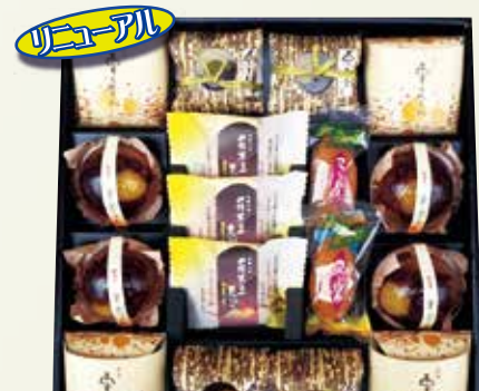
W-35 松濤菓 しょうとうか <17個入>