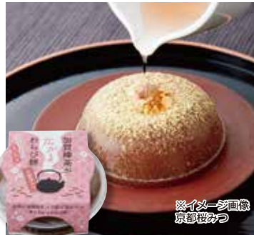
※イメージ画像 京都桜みつ