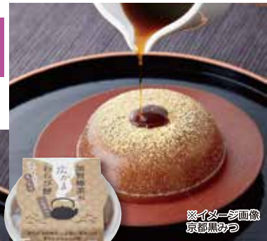
※イメージ画像 京都黒みつ