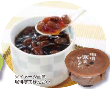
※イメージ画像 珈琲寒天ぜんざい