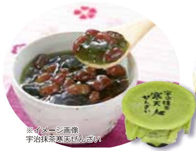
※イメージ画像 宇治抹茶寒天ぜんざい